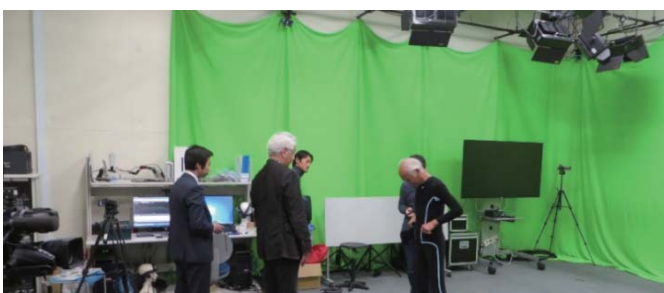
モーションキャプチャによる動作解析