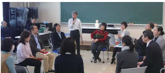
コミュニケーション能力向上研修