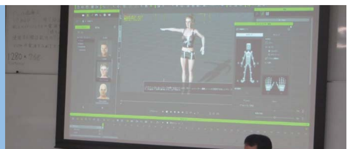
3DCG 制作ソフト関連研修