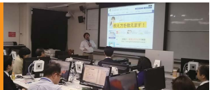
インストラクショナル・デザイン研修